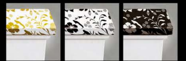
香槟金 Champagne Gold 纯净白 Pure White 深情黑 Solemn Black

笛柯现代版独树一帜的风格，巧妙地揉合了古典设计与现代气息，两者各显特色，为浴室披上时尚外衣，更有多种时尚花纹底色选择。