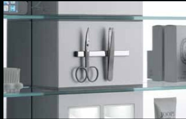
Anziehend – wirkt die Magnetschiene auf Utensilien aus Metall. Attractive – that's exactly what the magnetic strip is to metal accessories.