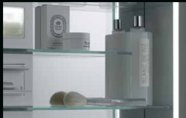
Im Handstreich – lassen sich die kürzeren Glasböden verschieben, sodass auch hohe Gegenstände im Schrank Platz finden.

One simple move – you can slide the shorter glass shelves from side to side to make room for even tall objects in the cabinet.