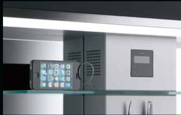
Da ist Musik drin – über den MP3-Anschluss oder via integriertem RDS-Radio. Music to your ears – thanks to an MP3 connection or integrated RDS radio.