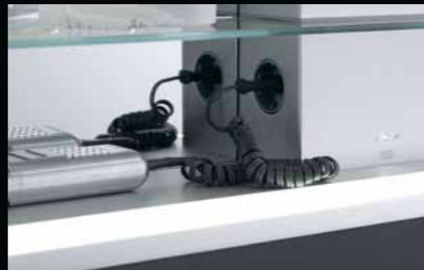
Am Fuß der Funktionssäule findet sich die Energiezentrale – mit integrierter Steckdose und LED Touch Sensor mit Dimmfunktion. The bottom area is the powerhouse of the multi-functional column – it features an integrated socket and LED touch sensor with dimmer function.

For bits and pieces and much more besides – different shelves and compartments keep things tidy and let you see everything.