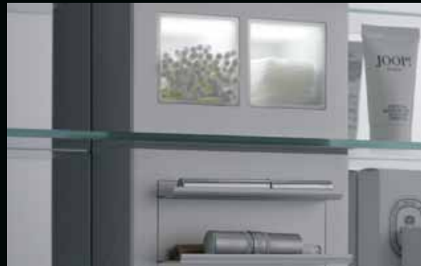
Für dies und das und noch viel mehr – unterschiedliche Ablagen schaffen Ordnung und schenken Übersicht.

For bits and pieces and much more besides – different shelves and compartments keep things tidy and let you see everything.